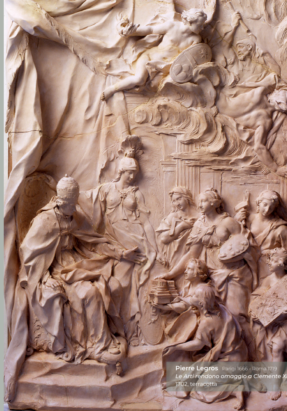
Pierre Legros Parigi 1666 - Roma 1719 Le Arti rendono omaggio a Clemente XI 1702, terracotta