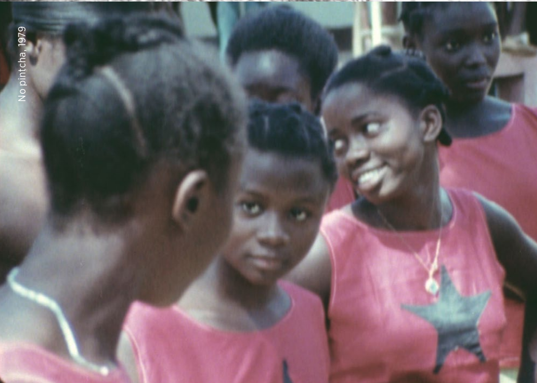
No pintcha, 1979