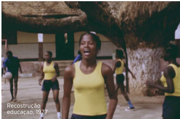
Recostrução educação, 1977