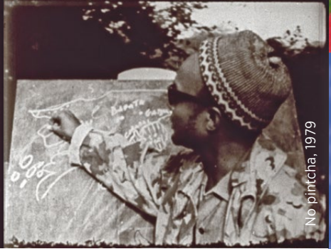
No pintcha, 1979