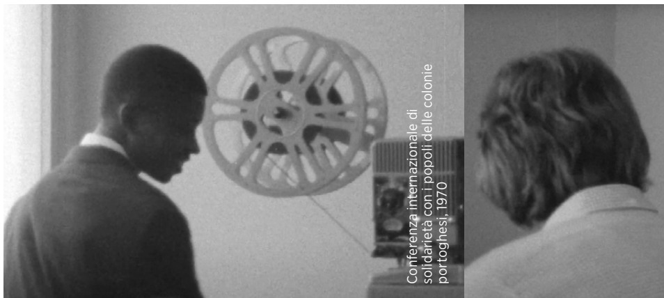
Conferenza internazionale di solidarietà con i popoli delle colonie portoghesi, 1970