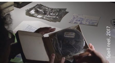
Spell reel, 2017

( Franco Cigarini, 1972, 24' ), e documenti conservati nell'Archivio Soncini-Ganapini e nell'Archivio Cigarini (Biblioteca Panizzi di Reggio Emilia).