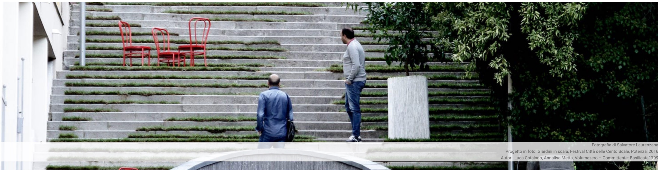
Progetto in foto: Giardini in scala, Festival Città delle Cento Scale, Potenza, 2016 Autori: Luca Catalano, Annalisa Metta, Volumezero – Committente: Basilicata1799